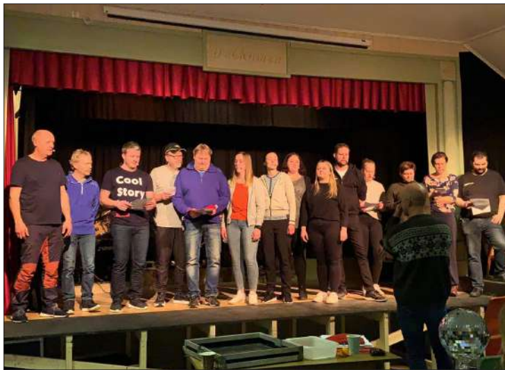
NYRUNDE: 3. juledag er det premiere på «Speloppmakerier» i Lunheim forsamlingshus.